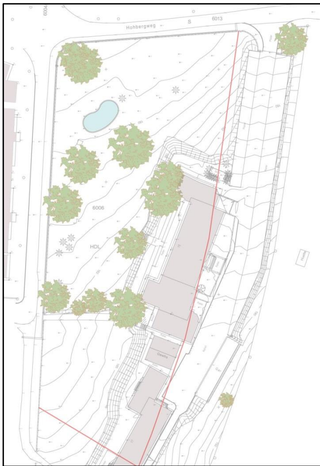
Abb. 6: Erhaltenswerte und soweit wie möglich zu sichernde Bäume (Werkgruppe Lahr, Auszug).

Die aktuelle Planung des Gebiets ist unter Punkt 2.2 und in Abb. 3 dargestellt. Abb. 6 zeigt den nach aktuellem Stand zu erhaltenden Baumbestand.