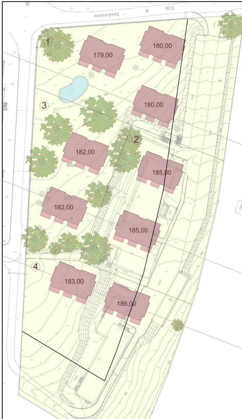
Abb. 3: Bebauungsplanung (Stand Februar 2015) für das AKAD Gelände (Werkgruppe Lahr, modifiziert).

Die aktuelle Planung sieht folgende Bebauung unter weitgehendem Erhalt des älteren Baumbestandes vor ( Abb. 3 ).