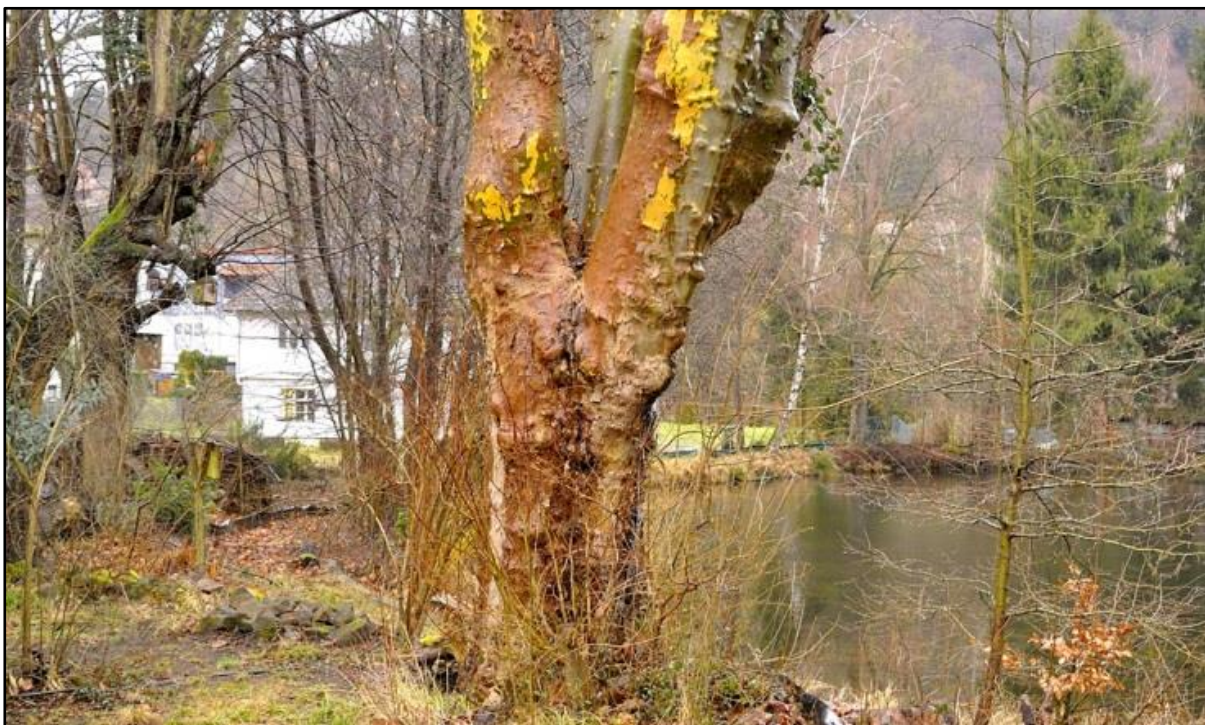
Abb. 5: Hohbergsee nördlich des AKAD Geländes; vom Gelände durch den Hohbergweg getrennt. Das Schutzgebiet wird von einer hohen Dichte von Erdkröte, Grasfrosch und Bergmolch, vereinzelt Teichmolch besiedelt; an Vögeln kommen Teich- und Blässhuhn, Stockente vor, der Eisvogel ist regelmäßiger Nahrungsgast (weitere Details sind den Aufzeichnungen des NABU Lahr zu entnehmen).