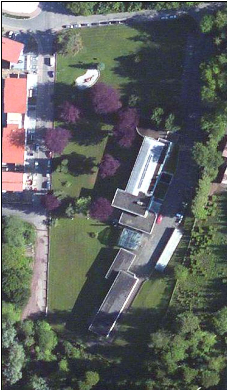
Abb. 2: Struktur des AKAD-Geländes. (Luftbild). Gut zu erkennen sind die Blutbuchen, die in ihrer Ästhetik prägend im Gelände sind.

Die ca. 2.1 ha große Untersuchungsfläche weist Bebauung der ehemaligen Akademie, Vielschnittrasen (mit quasi wöchentlichem Schnitt zur Vegetationsperiode; mdl. Mitt. Herr Baum/NABU), Altbaumbestand (vorwiegend Blutbuche), zudem Koniferengehölze, kleine Strauchinseln und Wege/Straßen auf ( Abb. 2 ). Momentan wird die Fläche nicht genutzt.