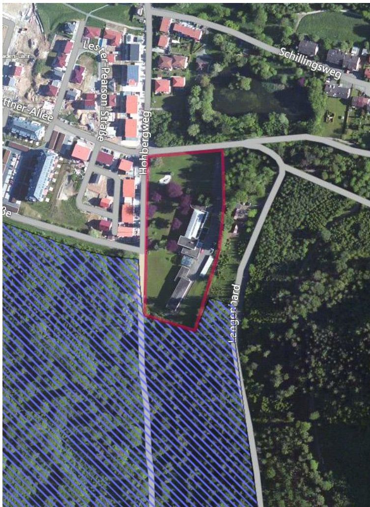
Abb. 1: Lage des AKAD Geländes in Lahr (Bing Luftbild, modifiziert). Schraffiert ist der Teil des FFH-Gebiets Schwarzwald-Westrand von Herbolzheim bis Hohberg (DE7713341; Details siehe Kapitel 2 ).

Auf dem AKAD Gelände in Lahr ist eine neue Wohnbebauung geplant. In Absprache mit der Stadt Lahr, der Werkgruppe Lahr, Maio Immobilien und dem Planungsbüro Kamm + Pohla / Lörrach soll für das ca. 2.1 ha große Gelände eine kurze artenschutzrechtliche Beurteilung nach §44 Bundesnaturschutzgesetz (BNatSchG) durchgeführt werden.