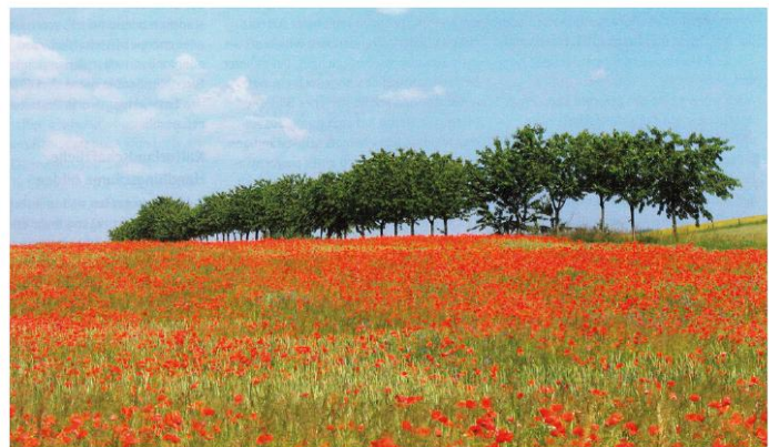
Referenzfotos „Landschaftspark Stegmatten“