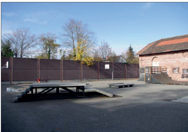
Skateplatz im Zentrum des Areals