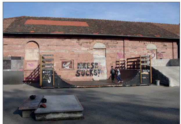
Skateplatz und Kühlhalle mit zugemauerten Fassadenöffnungen