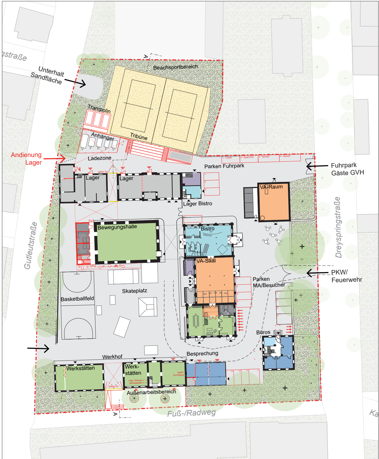
Räumliches Szenario - schematischer Grundriss EG | M 1:750