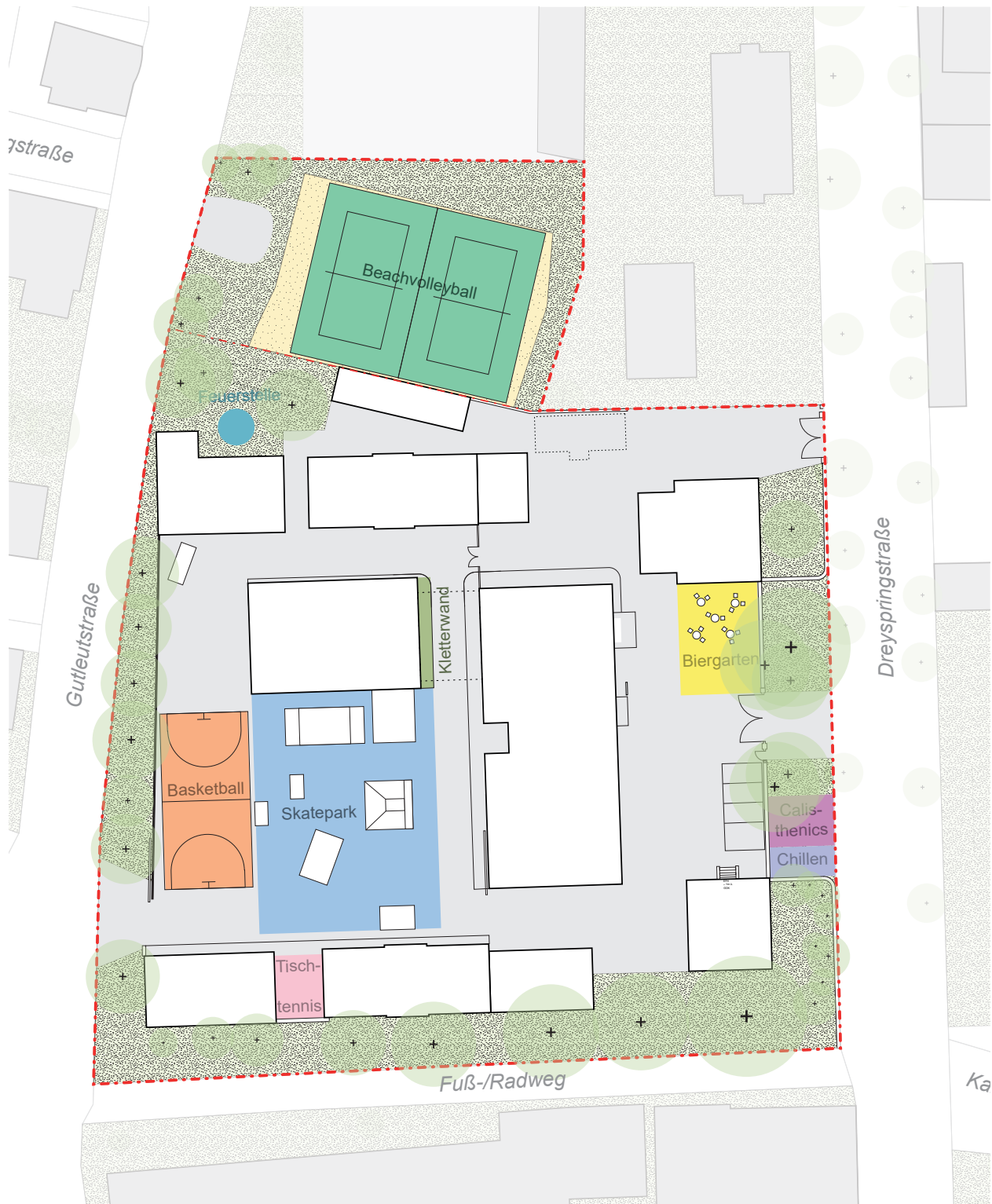
Aktuelle Nutzungen im Außenraum auf dem Schlachthofareal | M 1:750