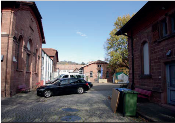
Hof mit Parkplätzen und Biergarten am Hauptzugang zum Gelände