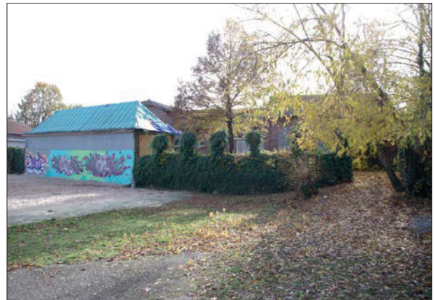
Übergang zum Beachsportbereich mit baufälligem Sozialgebäude am linken Bildrand