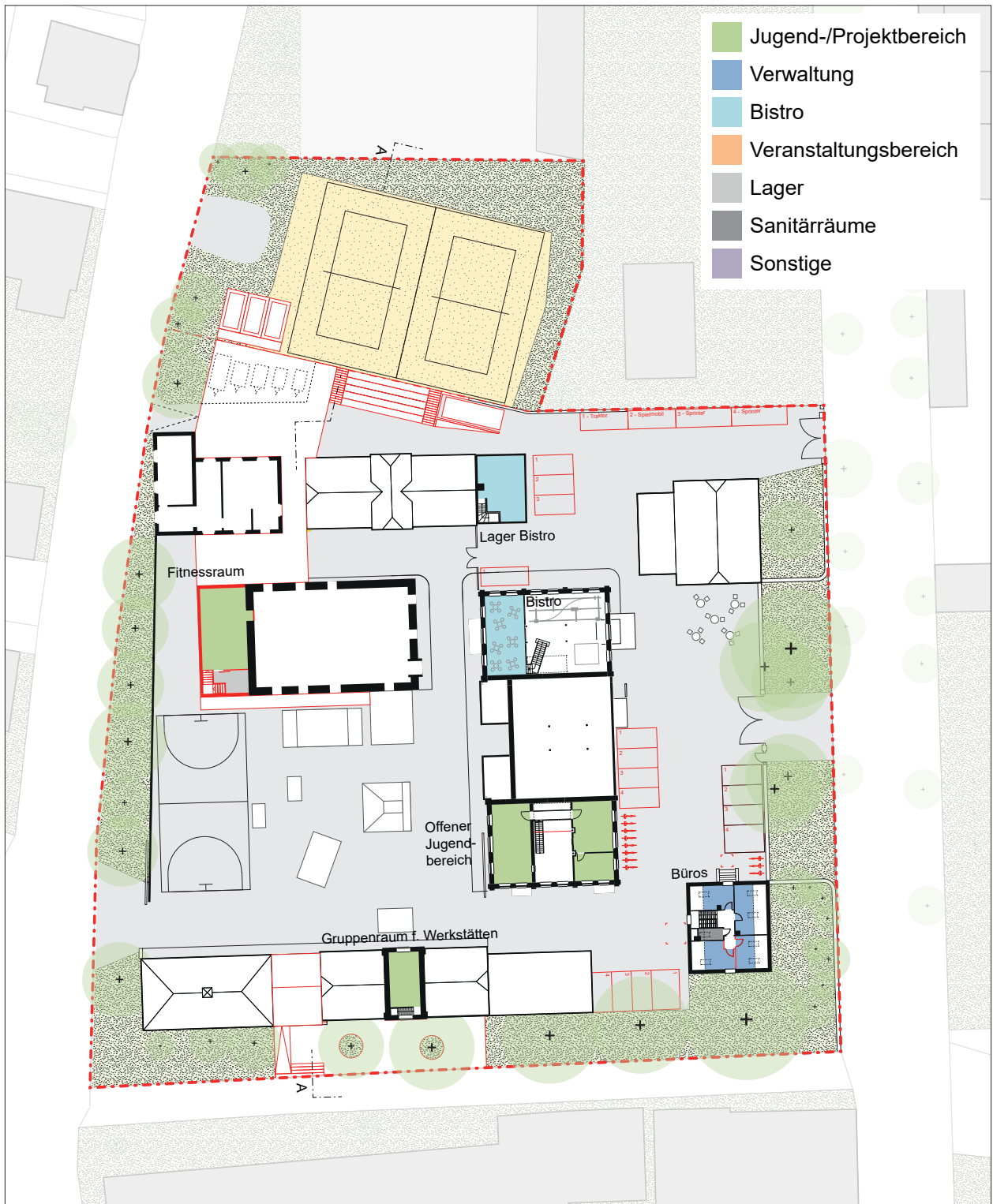
Räumliches Szenario - schematischer Grundriss OG | M 1:750