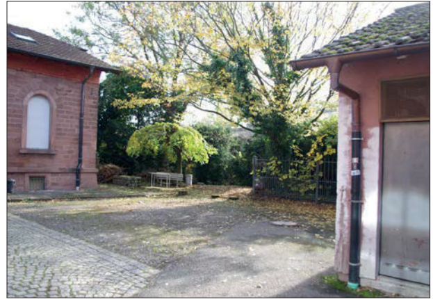
Ungenutzte Nische zwischen ehem. Schweinestall und Verwaltungsgebäude