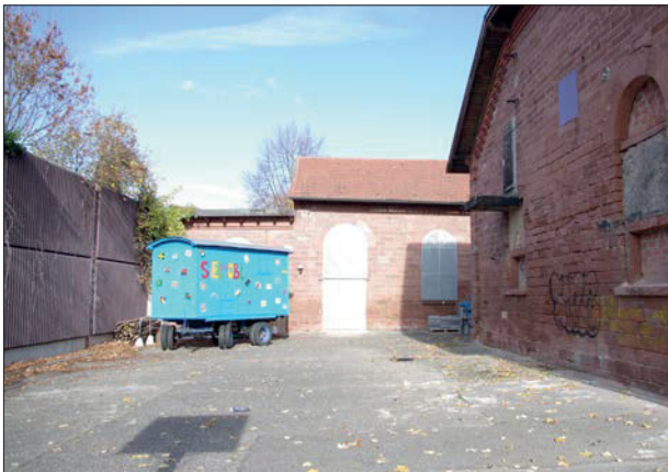
Abstellplatz des Spielmobils vor der Lärmschutzwand seitens der Gutleutstraße