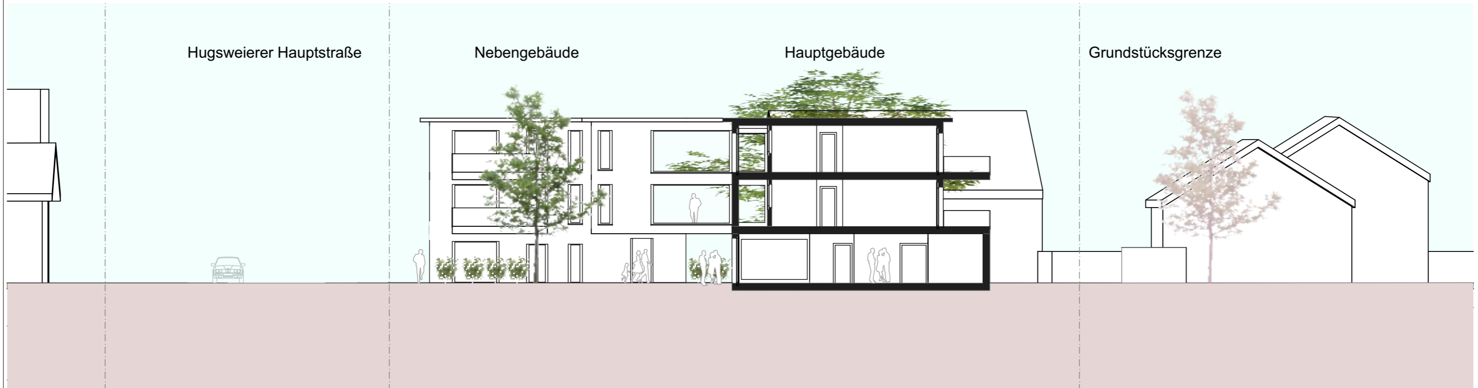
Schnitt durch das Hauptgebäude