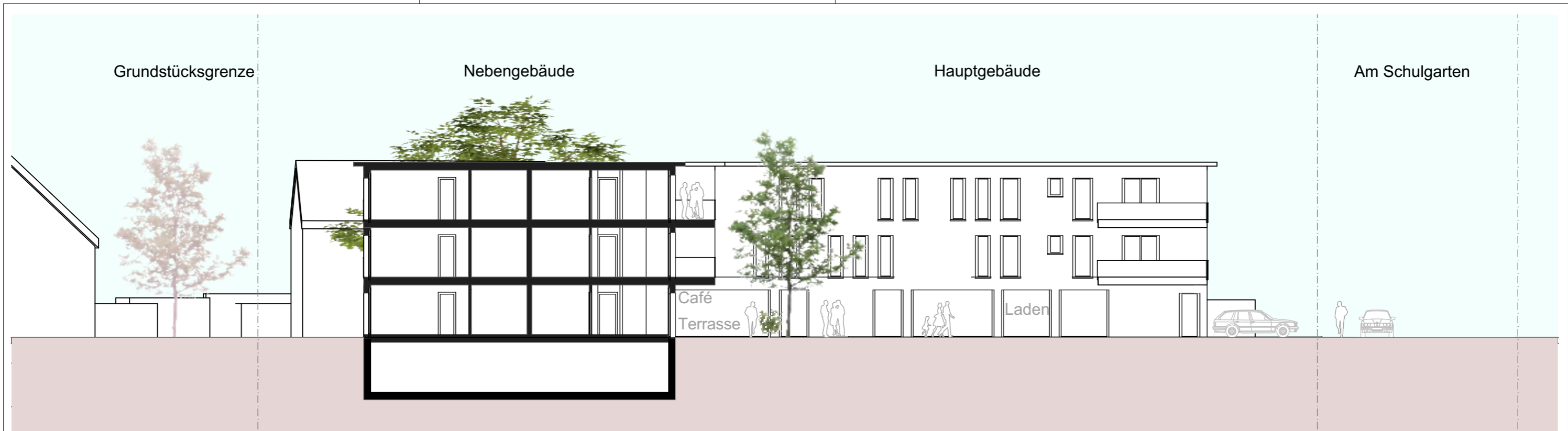
Schnitt durch das Nebengebäude